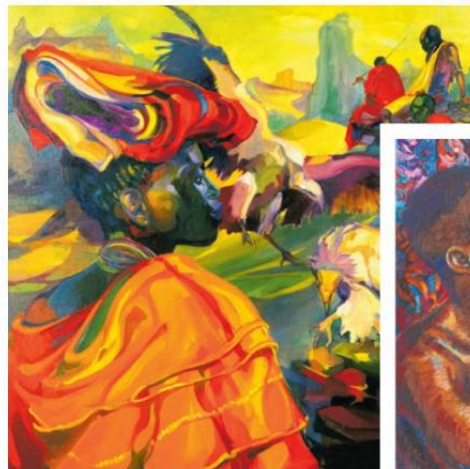
KRAFTVOLL | Die exotischen Gemälde von Ruth Baumgarte entfalten beinahe einen magischen Zauber.

Der Kunstshop Preiss Fine Arts (1., Bauernmarkt 14) präsentiert Werke des Schweizer Künstlers Markus Klinko, der in seiner Fotoserie „David Bowie Unseen“ den britischen Superstar auf ungewöhnliche Art porträtiert. Klinko legt dem Ausnahmemusiker nämlich Wölfe an die Hand. preissfinearts.com