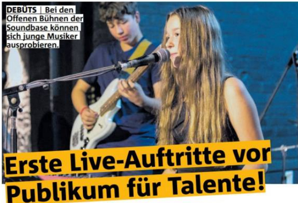
DEBÜTS | Bei den Offenen Bühnen der Soundbase können sich junge Musiker ausprobieren.