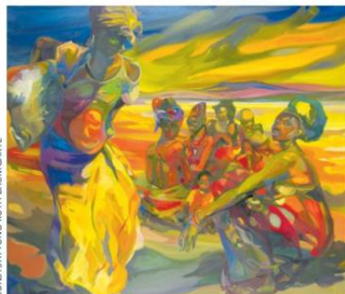
KUNSTSTIFTUNG RUTH BAUMGARTE